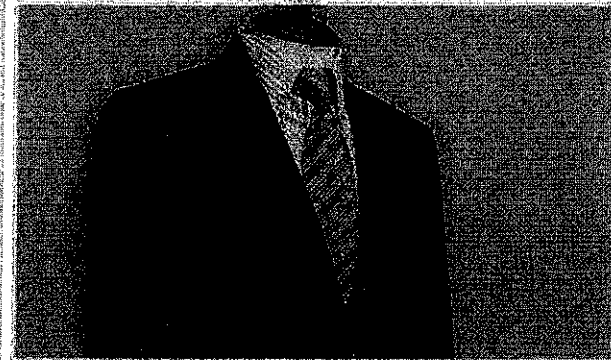
13万円の納付額で取り返れるオールシーズン用のオーダースーツ。

津島市ではふるさと納税で、市内の毛織物会社が取り返す生地を... 使ったオーダーメイドのオーダーメイドが人気を集めている。返礼品として... の納付額として返礼品を「オーダーメイド」の生地を納付額で行く... という。